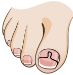
CORRECTIE MET EEN NAGELBEUGEL